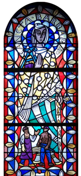
Barbara-Fenster in der St.-Gertrud-Kirche